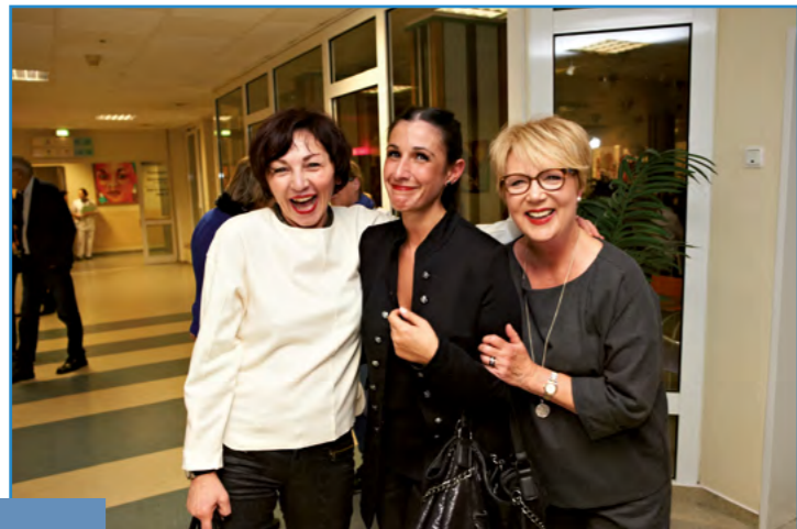
Musikalische Begleitung war dabei