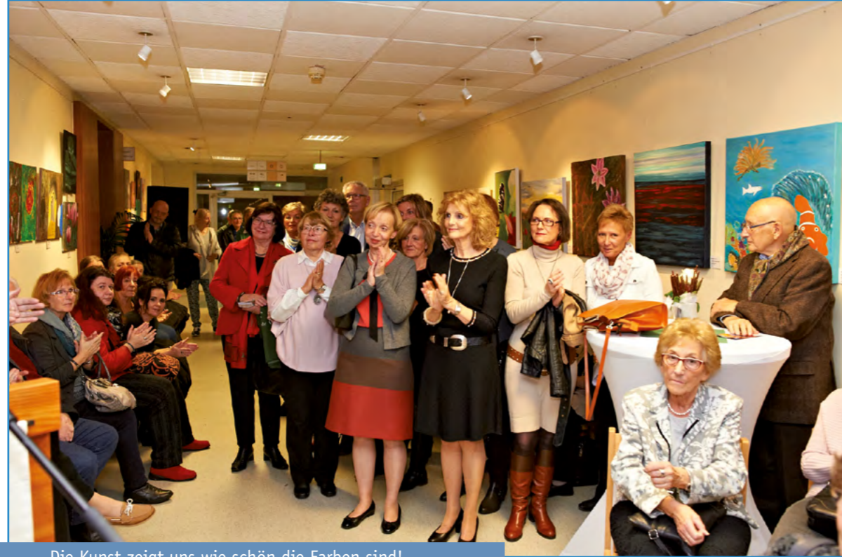
Die Kunst zeigt uns wie schön die Farben sind!