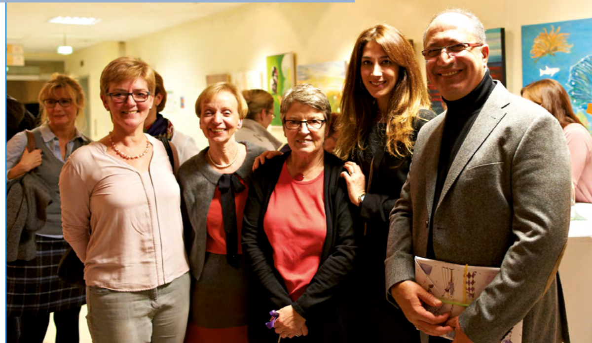
The art shows us how beautiful the colors are!