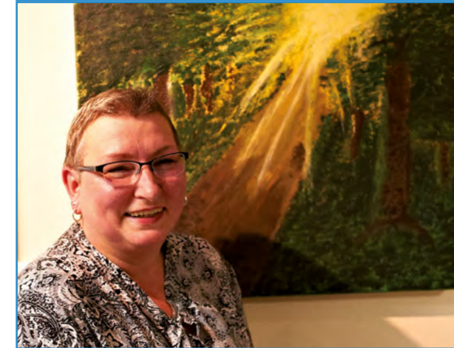
Wunderbare Bilder. Jedes Bild hat seine eigene Geschichte.